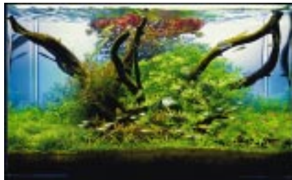
Una muestra de Acuario Natural . Un diseño delicado y encantador. (Acuario de Takashi Amano)

Evidentemente, ambas escuelas son coexistentes y no necesariamente deben predominar en un acuario, ya que al combinarlas los resultados son espectaculares.