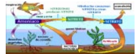
Un esquema del Ciclo del Nitrógeno

Para eliminar los nitratos utilizamos cambios de agua (las plantas y algas utilizan nitratos para su alimentación, pero en baja cantidad). Aunque existen algunos filtros que cumplen esta función, se siguen utilizando los cambios de agua, ya que ningún filtro de este tipo nos asegura la eliminación completa de nitratos. Los filtros existentes