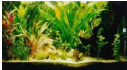
Una Filtración adecuada, la base de un acuario saludable

*Hay que entender que estos filtros pueden realizar tanto filtración mecánica, biológica como química dependiendo del material que se use en su interior.