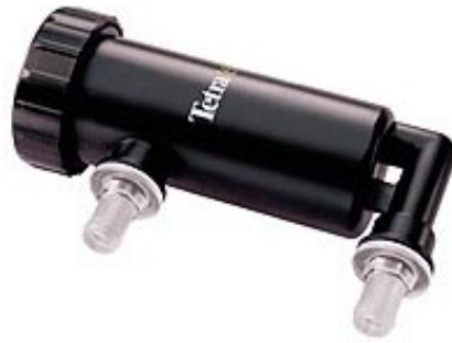
Un Esterilizador Ultravioleta es una excelente adición para un acuario, ya sea marino o de agua dulce.