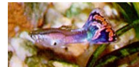
Guppy Macho ( Poecilia reticulata )

no que le subas la temperatura lentamente hasta llegar a 32 °C (por unos 3-5 días). A esta temperatura el parásito que provoca el pto. blanco muere. Son peces resistentes y no deberías tener problemas, siempre y cuando aumentes la temp. lentamente. Además oxigena bien el agua (con algún difusor, por ej.), ya que a esta Temp. el oxígeno es menos soluble en el agua. Si observas algún problema vuelve a bajar la temperatura. (siempre lentamente). Este es el método natural más efectivo. Y aunque use algún medicamento, siempre subo la Temp. El más propenso a contagiarse es el Molly. Con éste hay que tener cuidado, ya que se debilita fácilmente con el pto. blanco, llegando a morir.