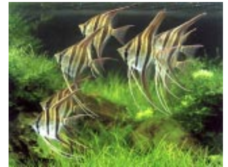
Pterophyllum altum © Takashi Amano