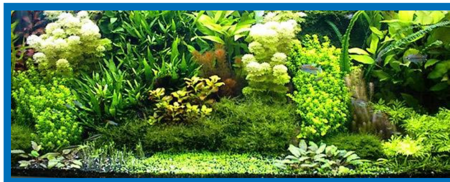
Una hermosa muestra de paisajismo acuático del tipo Holandés . La adecuada distribución de las plantas, según tamaño y textura, logra un efecto impresionante. (Acuario perteneciente al acuarista holandés Frode Roe)

Hasta acá la tarea es relativamente sencilla ya que la decoración del acuario es totalmente personal y dependerá del gusto de cada persona. El ideal es tratar de que el acuario funcione un tiempo sin la presencia de peces para que éste madure, las plantas se adapten y pueda formarse el equilibrio final entre peces, plantas y bacterias nitrificantes.