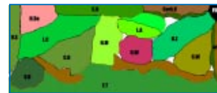
Un diagrama facilitará la adecuada distribución de plantas y otros ornamentos

en el acuario en grupos, las que pueden colocarse en rocas o troncos, las que forman praderas, las que flotan etc., ya que de ello dependerá su ubicación final en el acuario, manteniendo la regla básica de que las plantas pequeñas van adelante y las más grandes, atrás. Una vez claro este punto podemos comenzar a diseñar nuestro acuario considerando además la posibilidad de incluir algunas rocas o troncos. Un buen método es el de dibujar en un papel una vista superior (mirando desde la parte de arriba del acuario) de manera de tener clara la distribución que las plantas y otros elementos tendrán en el acuario.