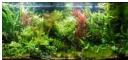
Una muestra de Acuario Holandés . Impresionante diseño. (Acuario de Robert Hudson)