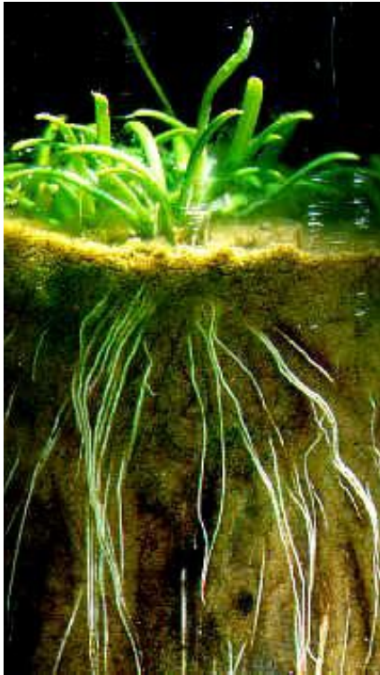
Sistema radicular en una Lobelia cardinalis

Para el acuarista, intensidades altas de luz son aquellas que saturan la fotosíntesis. Sólo las ampollitas de Haluro Metálico pueden entregar ese nivel de intensidad. Niveles medios de intensidad pueden ser obtenidos con entre 0,5 - 1 watts de luz fluorescente por litro de agua. A este nivel la fotosíntesis no está al máximo, pero aún es mayor que la respiración. Cualquier nivel menor al anterior es baja luz. En este punto, la mayoría de las plantas se acercan a su PCL y sólo las más tolerantes prosperarán. La atenuación de la luz en el agua es específica en cuanto a la longitud de onda. El agua absorbe luz en las bandas de infrarrojo y ultravioleta del espectro, los solutos