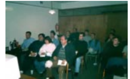
Una vista de la concurrencia.