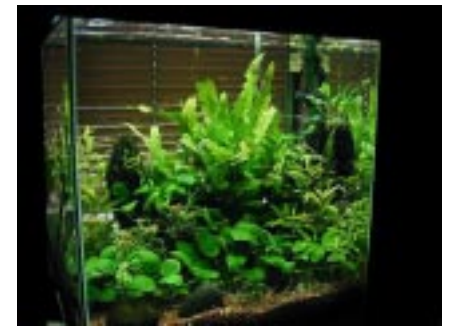
Un hermoso acuario plantado donde las algas son mantenidas bajo control.

Por más de 2,5 mil millones de años las algas fueron las únicas plantas sobre la tierra. Durante este periodo las algas jugaron un decisivo papel en el desarrollo ecológico, permitiendo el progresivo desarrollo de la flora y fauna sobre el planeta.